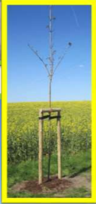
„Baumpflanzung“ Düshorn im Mai 2016